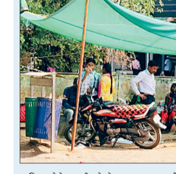
बारिश और गर्मी के दिनों में बसों का इंतजार करने वाले लोगों को होने वाली परेशानी से निजात दिलाने के लिए नगर प्रशासन ने लोहे के पाइप लगाकर ऊपर जौन कारपेट लगा दिया है। वहीं लोगों के बैठने के लिए कुछ एसी कुर्सियां रखा गया है जिसमें लोगों ठीक से बैठ भी नहीं पाते हैं। कथित प्रतीक्षालय में न तो गर्मी से राहत मिलती है और न

बारिश होने पर भीगने से बचा जा सकता है। इस कथित प्रतीक्षालय में मवेशियों का जमावड़ा रहता है साथ ही लोग बाइक आदि की पार्किंग भी करते हैं। लोगों के परेशान होने के बाद भी जनप्रतिनिधि प्रतीक्षालय निर्माण में रुचि नहीं दिखा रहे हैं वहीं अधिकारी अपने चेहर में एसी का मजा ले रहे हैं। गया था। करीब तीन साल पहले तत्कालीन अधिकारियों ने बिना सोचे समझे सड़क चौड़ीकरण के नाम पर यात्री प्रतीक्षालय को ध्वस्त कर दिया जबकि वह चौड़ीकरण के दायरे के बाहर था। दोनों प्रतीक्षालय को तोड़ने के बाद अब तक उसका पुनर्निर्माण नहीं कराया गया।