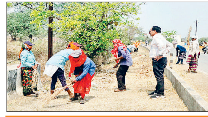
सड़कों का काराकल्प

सड़क अतरिया। क्षेत्र में कल रविवार से चैत्र नवरात्रि पर्व उत्साह से मनाया जाएगा। सभी देवी मंदिर में आवश्यक तैयारी पूर्ण कर लिया गया है। विधि विधान के साथ कल से आगामी आठ दिनों तक श्रद्धालुओं के मनोकामना ज्योति कलश जगमगाएगा। गांव के शीतला मंदिर एवं कुछ घरों में जोत जंजारा प्रज्वलित किया जाएगा। अंचल के नर्मदा मंदिर, घिरघोली के सिद्ध बाबा मंदिर, पैलीमेटा के अन्नपूर्णा मंदिर, चोराडाधाम, बंजारी मंदिर सहित अन्य स्थानों में बड़ी संख्या में जोत प्रज्वलित किया जाएगा।